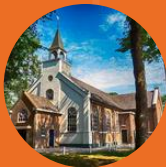
Gereformeerde kerk Ruinerwold