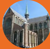
Grote of Maria Magdalenakerk Goes