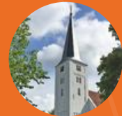
Protestantse gemeente Heiloo