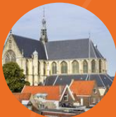
Grote kerk Alkmaar