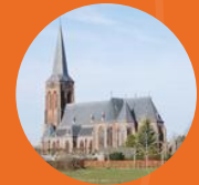
Sint-Martinus kerk Baak